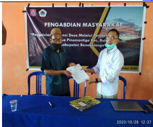
Gambar 4. Penandatanganan kerja sama