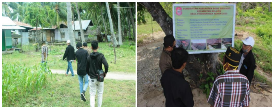
Gambar 3. Tinjau Lokasi wisata pantai pinomontiga