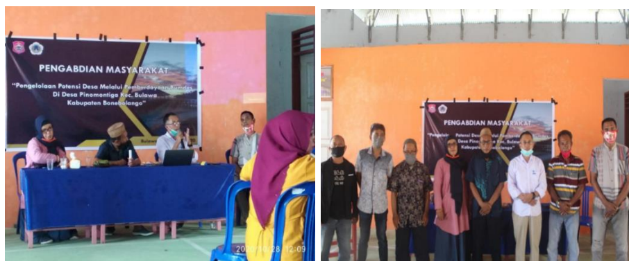
Gambar 2. Pelatihan dan pembekalan manajemen Bumdes

Pada pemetaan SDM ini sangat perlu dilakukan untuk melihat adakah sumber daya manusia yang memiliki kompetensi dalam bidang teknis, kemudian dilihat pula adakah SDM dalam bidang manajemen, serta sumber daya manusia dalam bidang rekayasa sosial. Setelah dilakukan pemetaan semua bentang yang ada maka harus dilakukan pemetaan potensi untuk memilih usaha apa yang akan dipilih untuk dikelola oleh Bumdes tersebut, hal ini dimaksud agar usaha yang kelak akan dilakukan benar benar hasil dari kajian secara mendalam dan memiliki data penunjang sehingga usaha yang akan dikelola Bumdes tersebut akan berhasil dengan baik dan tentunya dapat berimbas pada peningkatan kesejahteraan masyarakat Desa Pinomontiga.