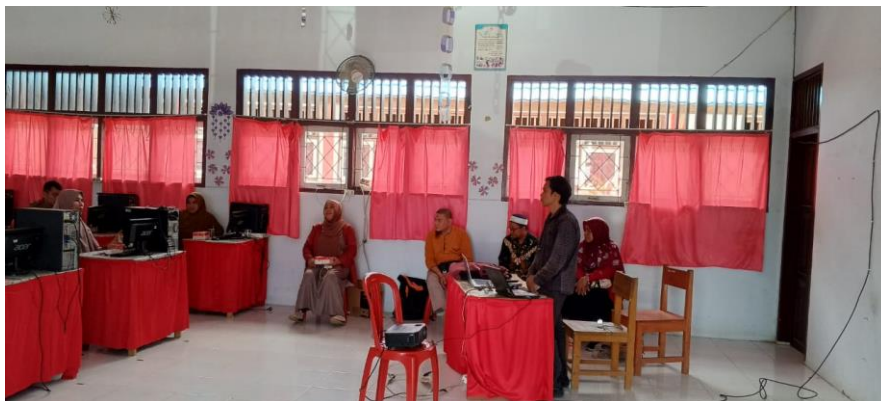
Gambar 1. Sosialisasi Pentingnya Sistem Absensi