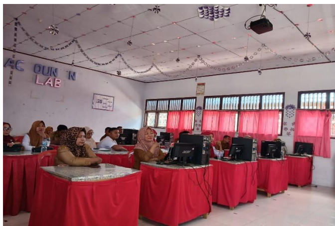
Gambar 5. Diskusi dan Tanya Jawab

Melakukan diskusi dan tanya jawab dengan guru-guru terkait proses absensi berbasis teknologi RFID dan disesuaikan dengan kondisi kelas dan jurusan di SMK 1 Kaidipang yang saat ini masih menggunakan sistem absensi konvensional