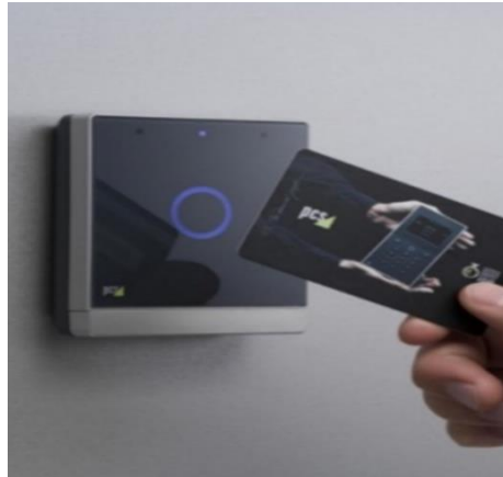
Gambar 2. Teknologi RFID