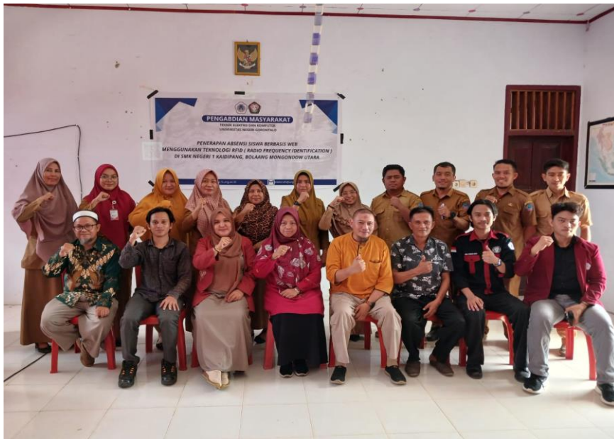
Gambar 6. Akhir Sosialisasi Sistem Absensi Berbasis Teknologi RFID