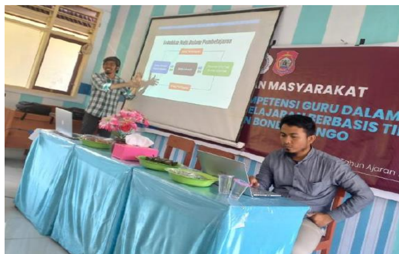
Gambar 3. Proses penyampaian materi