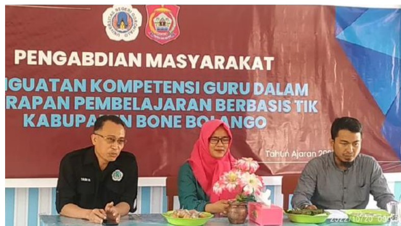
Gambar 2. Acara pembukaan, di hadiri oleh ketua Jurusan Teknik Elektro dan Kepspek

Persiapan kegiatan yang dilakukan oleh tim pengabdian di Sekolah Dasar Negeri 3 Kabila Bone diawali dengan sambutan baik dari ketua tim pengabdian dan oleh pihak mitra dalam hal ini kepala Sekolah Dasar Negeri 3 Kabila Bone yang didokumentasikan pada gambar 2 dan selanjutnya dilanjutkan dengan acara workshop.