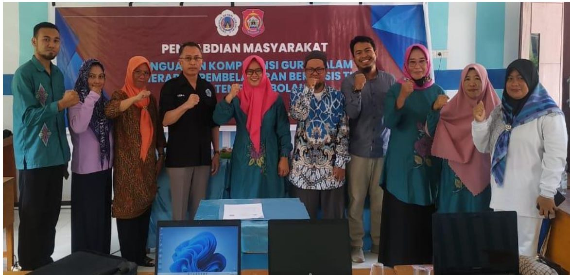
Gambar 7. Acara penutupan workshop

Penyampaian materi yang diperlihatkan pada gambar 3 mengenai penguatan kompetensi guru dalam penerapan pembelajaran berbasis TIK. Mitra dalam hal ini guru saat menerima materi diperlihatkan pada gambar 4. Setelah acara workd shop selesai dilanjutkan dengan penandatanganan dari ketua tim pengabdi dan kepala sekolah SDN 3 Kabila Bone yang diperlihatkan pada gambar 5 dan gambar 6. Selanjutnya adalah sesi foto bersama setelah acara selesai diperlihatkan pada gambar 7.