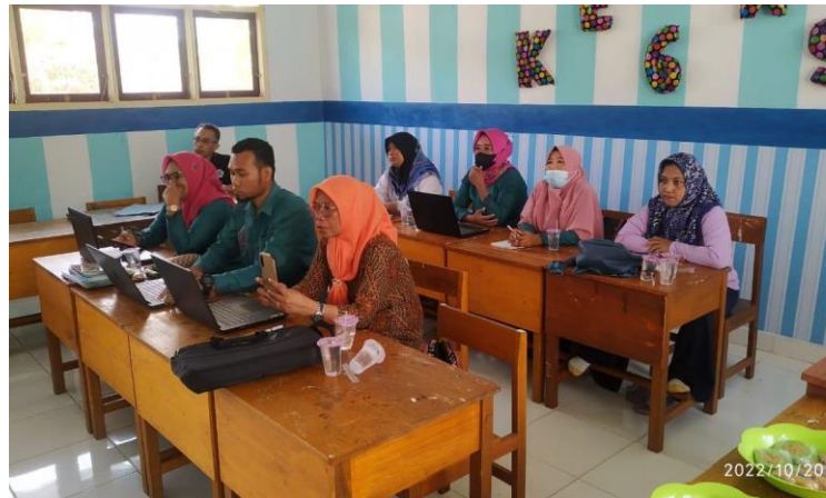
Gambar 4. Guru-guru focus dengan pemberian materi dari narasumber