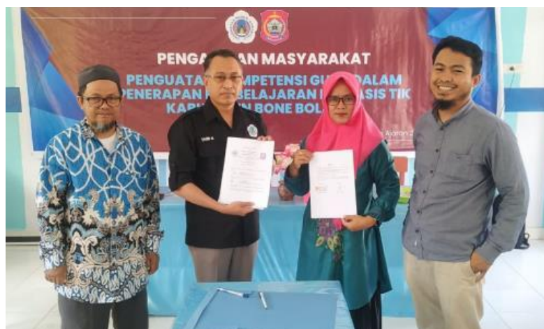
Gambar 6. Hasil penandatanganan IA