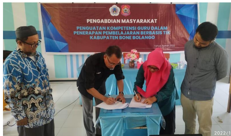
Gambar 5. Proses penandatanganan IA